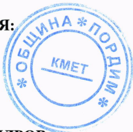
..... ИЛИЯН АЛЕКСАНДРОВ КМЕТ НА ОБЩИНА ПОРДИМ